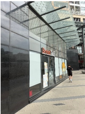
(S1 入口在 breadtalk 旁)

1. 於 Sun Avenue 大樓的 S1 棟右手邊 Office 入口進入(請不要走到 apartment 的入口)，當天會有試場人員帶領上樓)。